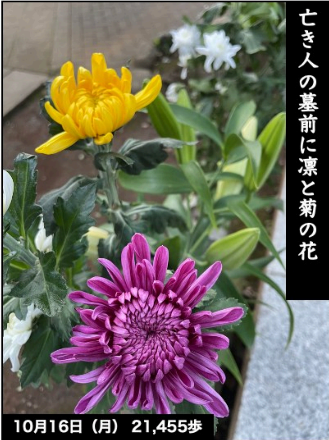
亡き人の墓前に凛と菊の花