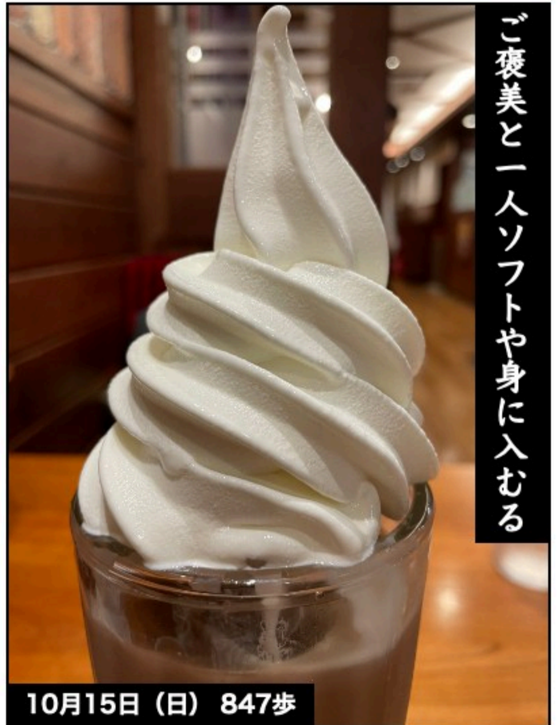
ご褒美と一人ソフトや身に入むる