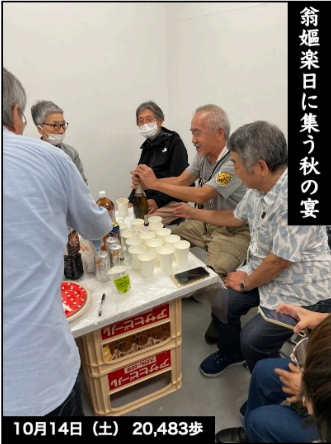
翁姫楽日に集う秋の宴