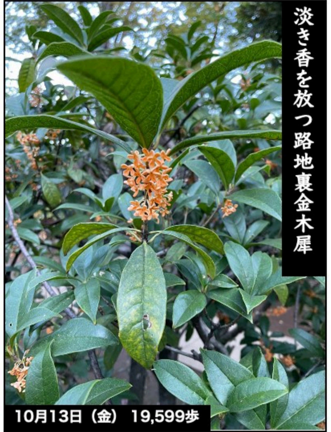
淡き香を放つ路地裏金木犀